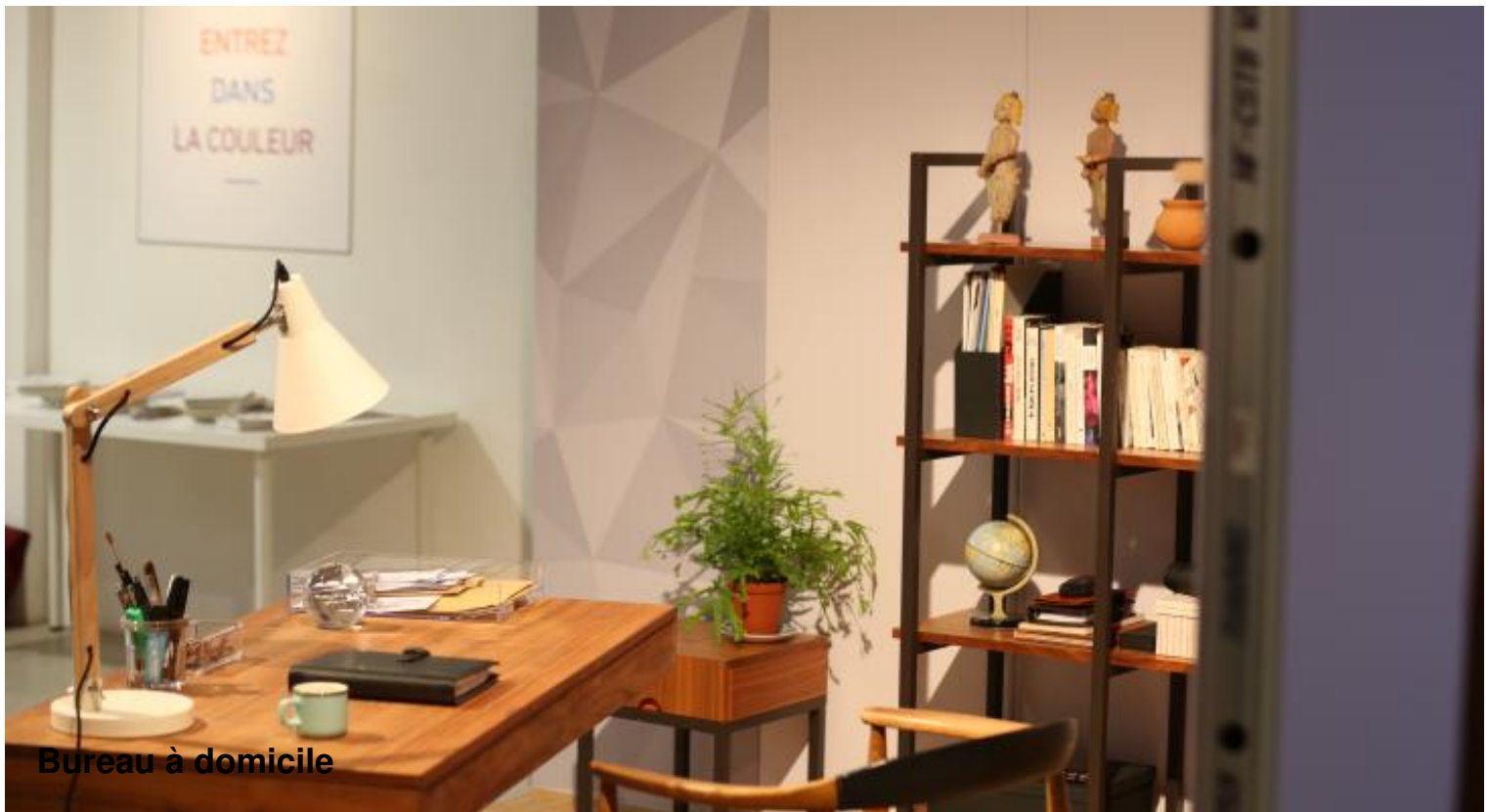
Bureau à domicile

Concernant l'isolation des fenêtres , le recours au double vitrage est un passage obligé pour se prémunir des nuisances sonores extérieures. Pour aller plus loin et profiter d'un résultat optimal, assurez-vous également que l'étanchéité de vos fenêtres est fonctionnelle et procédez au remplacement des joints s'ils sont trop usés pour remplir leur rôle. Encore une fois, la moindre faille d'air est source de passage du bruit ! Prenez donc le temps de vérifier le bon état des équipements de ventilation de votre intérieur : des entrées d'air indésirables laisseront également passer le bruit environnant... Dans le même ordre d'idée, faites le nécessaire pour insonoriser votre porte, à l'aide de joints tout autour de la porte, ou encore en recourant à un kit de capitonnage.