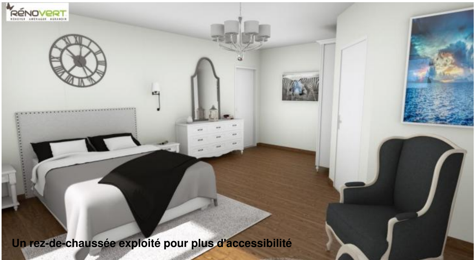
Un rez-de-chaussée exploité pour plus d'accessibilité

Nature du projet : maison individuelle de 2010