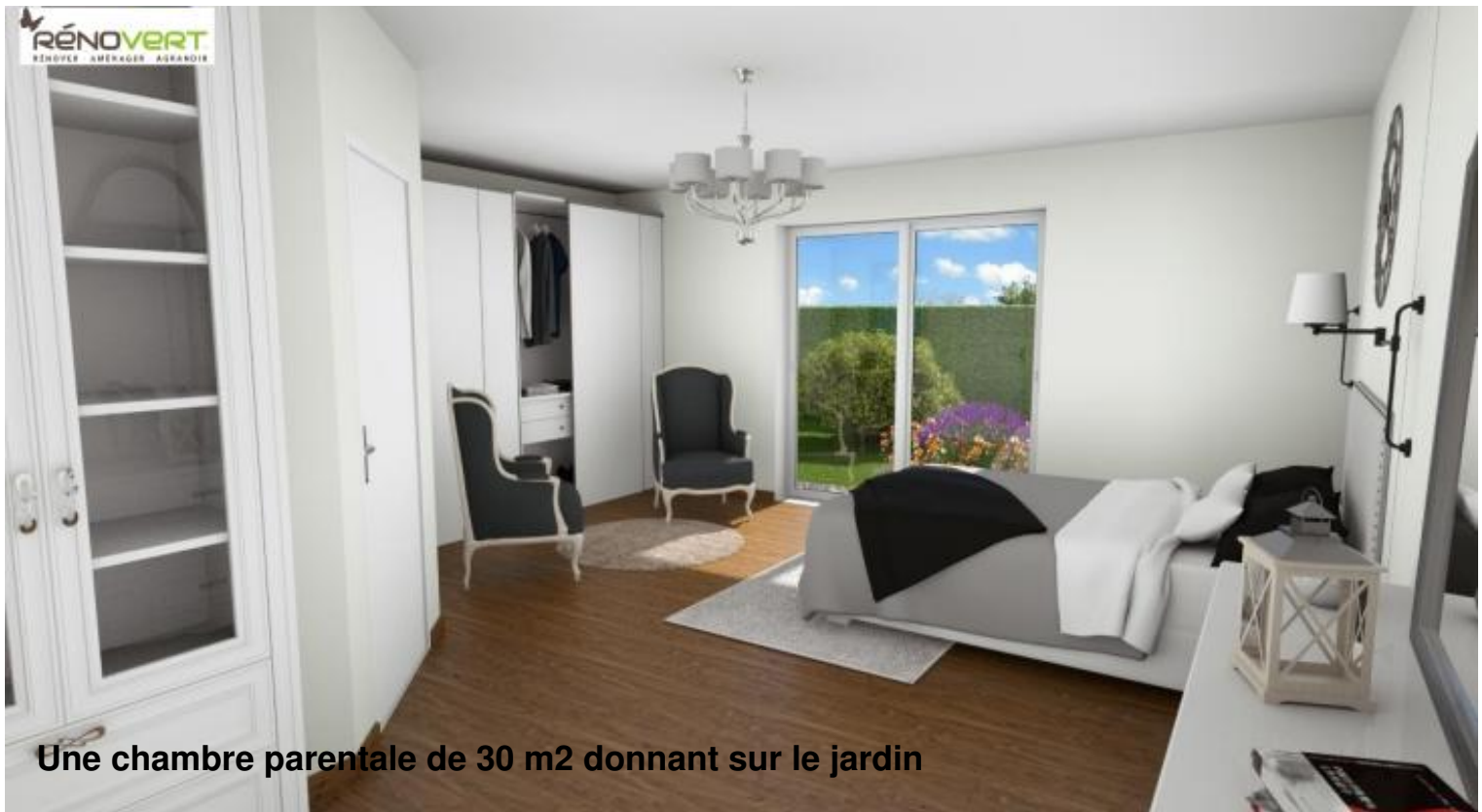
Une chambre parentale de 30 m2 donnant sur le jardin