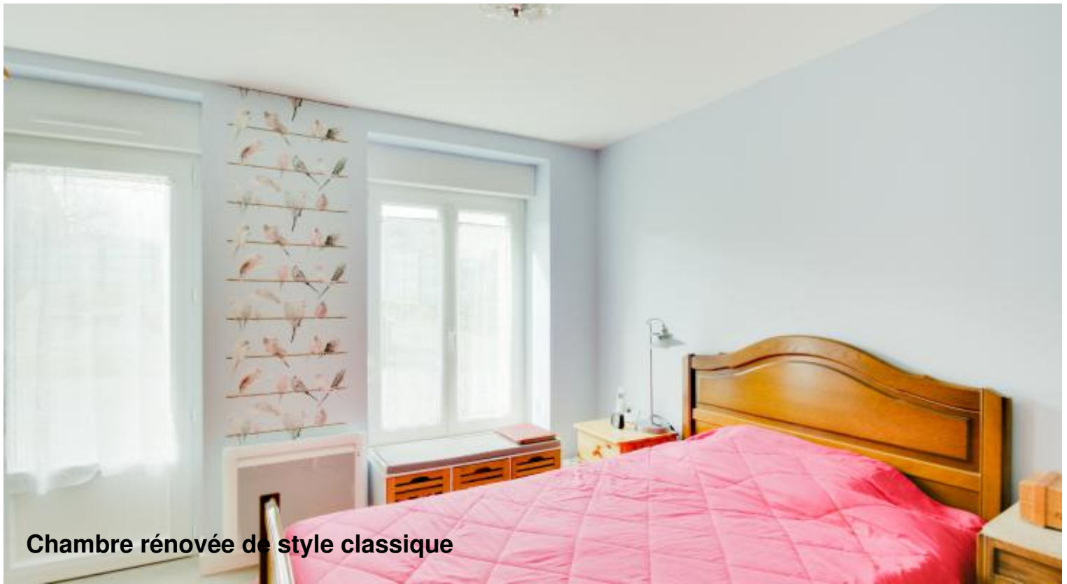
Chambre rénovée de style classique

Une femme et sa fille à la retraite décident de réinvestir ensemble cette maison traditionnelle bretonne , située dans la campagne proche de Saint-Malo en Ille-et-Vilaine (35), dont leur famille est propriétaire depuis plus de 50 ans. Pourtant se posent les questions de l'espace disponible et l'absence d'intimité au sein de cette maison familiale. Afin de répondre à leurs interrogations et de disposer