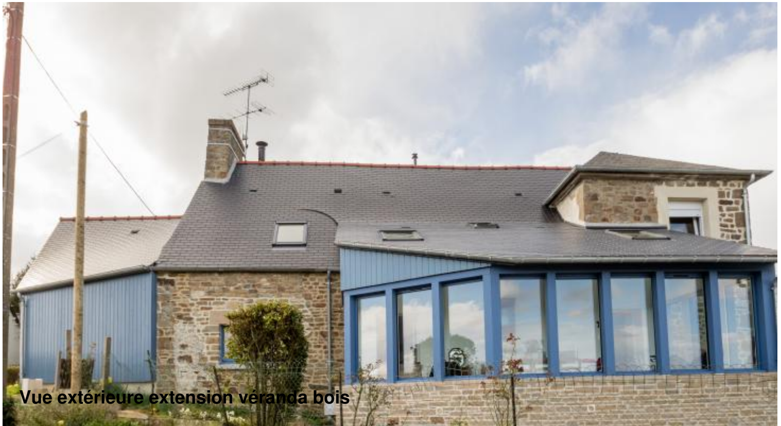
Vue extérieure extension véranda bois

Ce chantier de rénovation a consisté en la séparation en deux parties indépendantes d'une maison bretonne traditionnelle et de son extension dans un style moderne, à Saint-Malo (35).