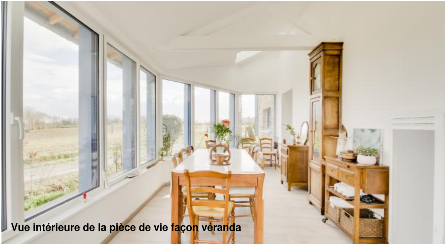
Vue intérieure de la pièce de vie façon véranda