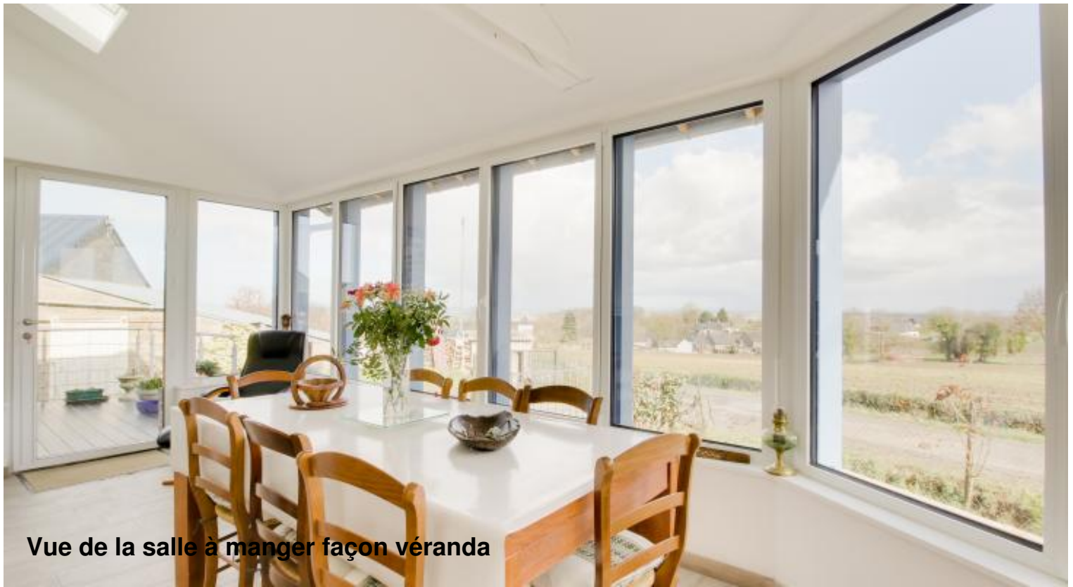
Vue de la salle à manger façon véranda