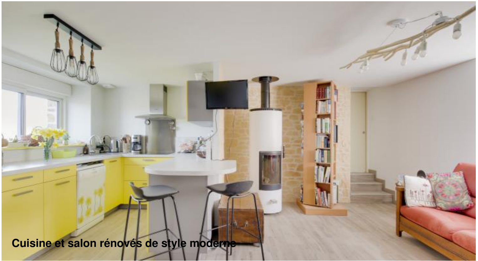
Cuisine et salon rénovés de style moderne